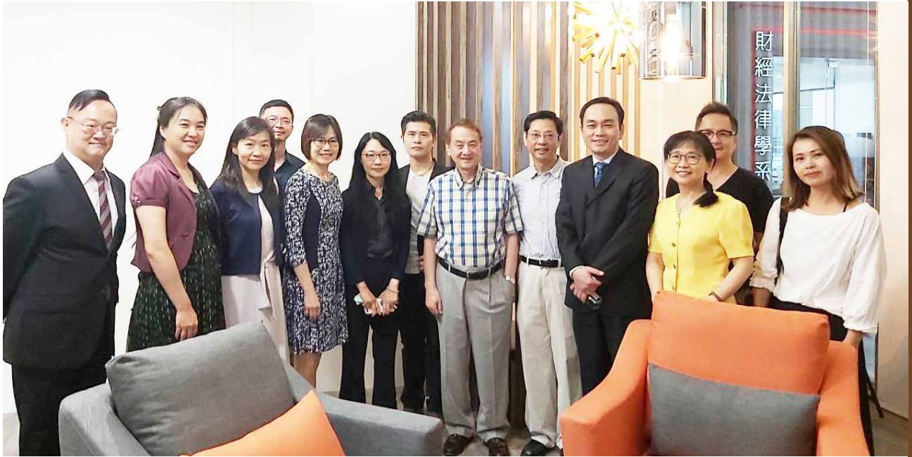
法學院教授聯誼室